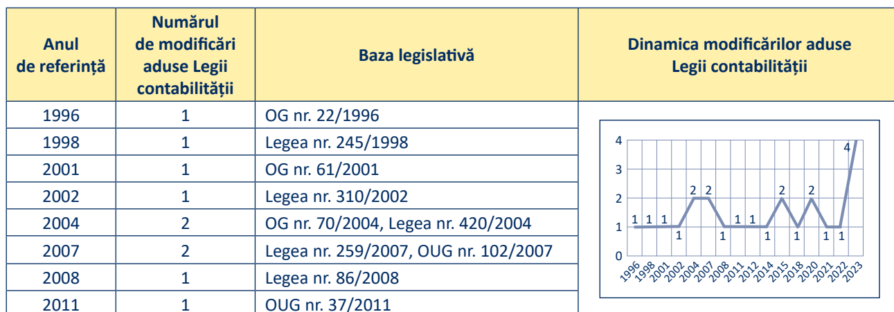
Tabelul 4. Numărul de modificări aduse Legii contabilității în perioada 1996-2023

Tabelul de mai jos ilustrează modificările aduse Legii contabilității nr. 82/1991 în perioada 1996-2023.